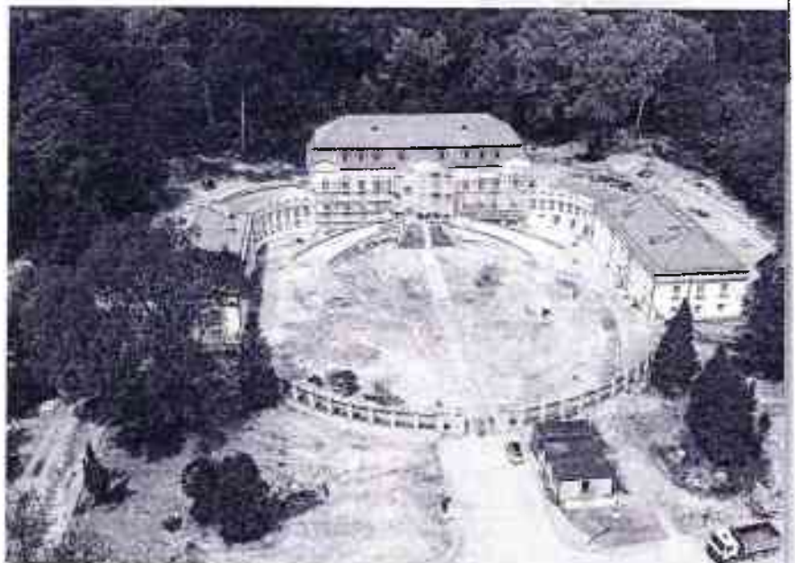
▼ Масштабная рэстаўрацыя палацава-паркавага комплексу ў вёсцы Сяцік Гродзенскага раёна. 2020 год

Паступова прасоўваюцца аднаўленчыя працы і на сядзібах у аграгарадску Падароск і вёсцы Краскі Ваўкавыскага раёна. Іх новымі ўладальнікамі сталі прыватныя