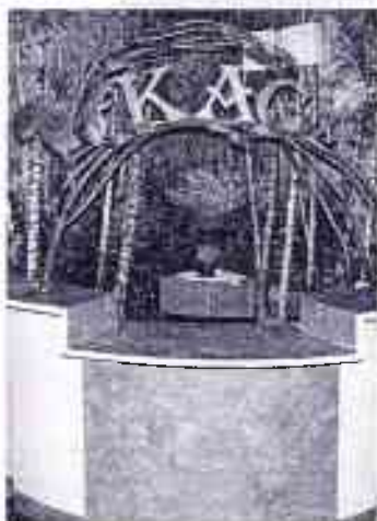
▲ У Музеі ваверкі у Вялікай Бераставіцы. 2020 год

дзяць музейна-мастацкую праграму для арганізаваных груп наведвальнікаў, якім пасля знаёмства з экспазіцыяй прапануюць акнуцца ў свет песенна-музычнага мастацтва. Такі прыём пакідае зусім іншае ўражанне ад наведвання музея, дазваляе пазнаёміцца акурат з тымі народнымі песнямі і мелодыямі, якія, напэўна ж, чуў у дзяцінстве вядомы паэт і якія, магчыма, натхнілі яго падчас працы над творами, прысвечанымі беларускім рэаліям.