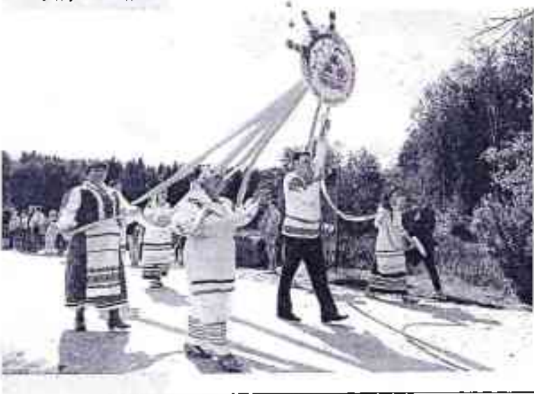
▼ У час фестывалю «Аугустоўскі канал у культуры трох народаў». 2017 год

Напрыклад, «твар» выбранай намі наўтад Шчучыншчыны там прадстаўлены святам паэзіі «У госці да Алаізы», якое збірае ў гарадскім пасёлку Астрына гасцей у гонар ішсьменніцы, ураджэнкі Шчучынскага раёна Алаізы Пашкевіч (Цёткі), фестывалем музыкі вядомага польскага музыканта, кампазітара і спевака беларускага паходжання Чэслава Нэмэна ў аграгарадку Васілішкі, святам кветак «Жалудок здзяйсняе мары», «Навадворскім фестам», авіяцыйна-спартыўным шоу «Авіядрайв-бай» у Шчучыне, святамі сякеры ў аграгарадку Ляшчанка і каменю ў аграгарадку Каменка, а яшчэ – «Грыбной талакой» у аграгарадку Першамайск, «Торбай смеху» ў аграгарадку Орля і фальклорным святам «Паміж намі, суседзямі», што праводзіцца раз у два гады ў аграгарадку Дэмбрава.